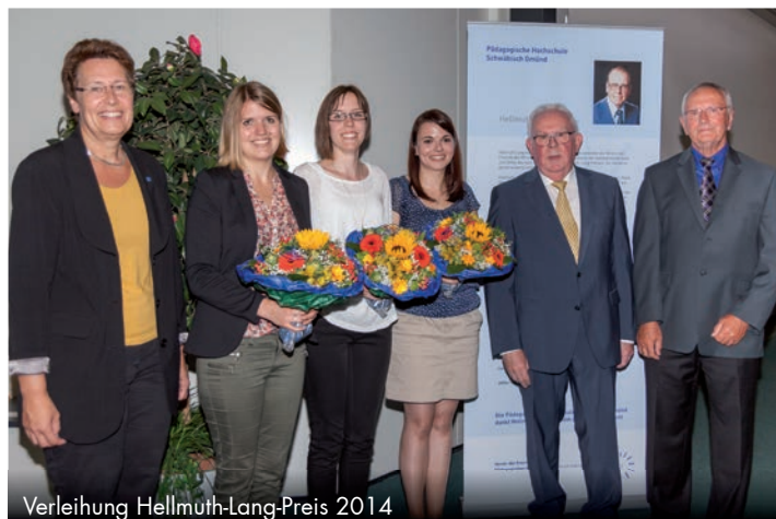
Verleihung Hellmuth-Lang-Preis 2014

Verein der Freunde der Pädagogischen Hochschule