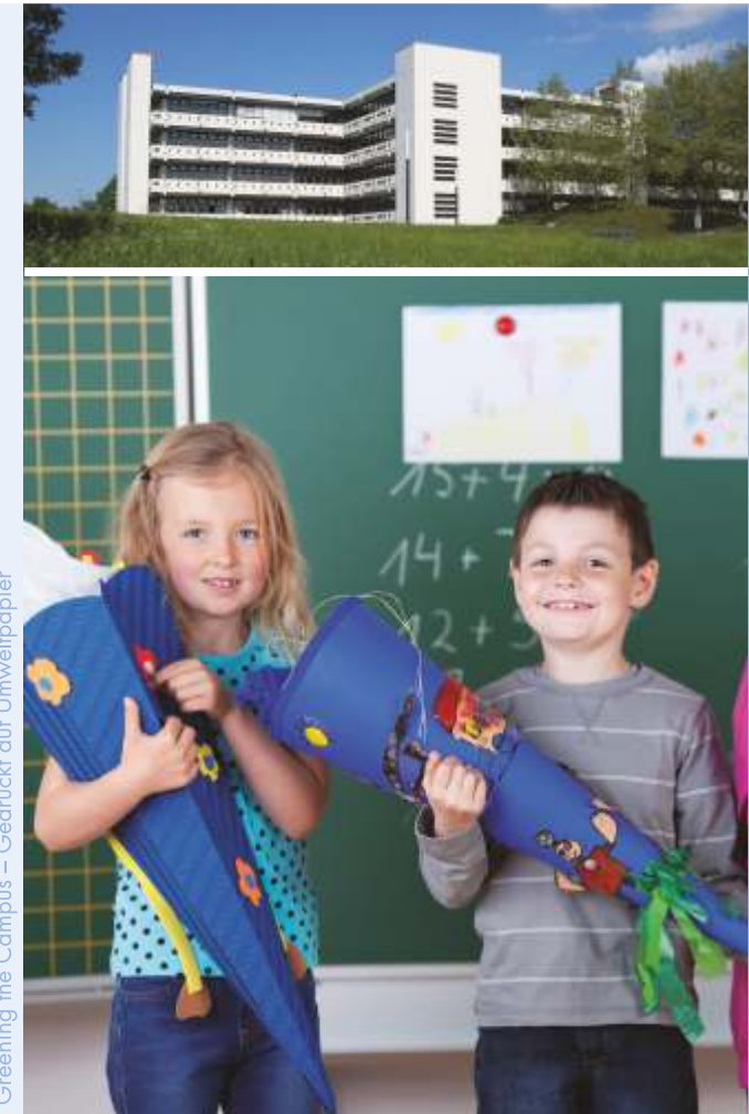
Greening the Campus – Gedruckt auf Umweltpapier

Pädagogische Hochschule Schwäbisch Gmünd Oberbettringer Straße 200 D-73525 Schwäbisch Gmünd Telefon +49 7171 983-0 Telefax +49 7171 983-212 E-Mail info@ph-gmuend.de