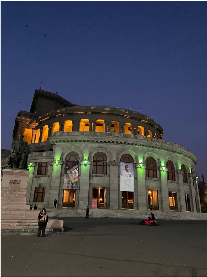
Das ist die Oper von Yerevan.