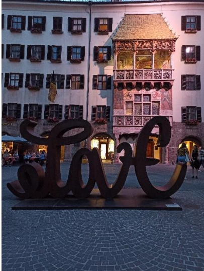
Love-Zeichen in Innsbruck vor dem Goldenen Dachl