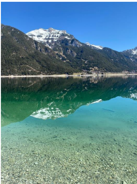
Pertisau, am Achensee