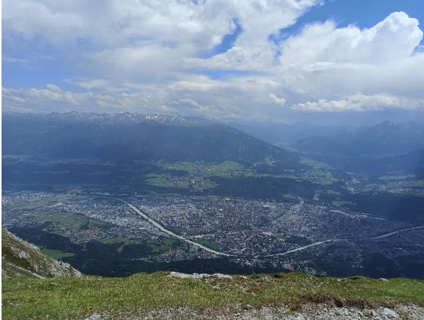
Aussicht von der Nordkette auf Innsbruck

Nähre Informationen dazu erhalten Sie im Akademischen Auslandsamt der Pädagogischen Hochschule Schwäbisch Gmünd.