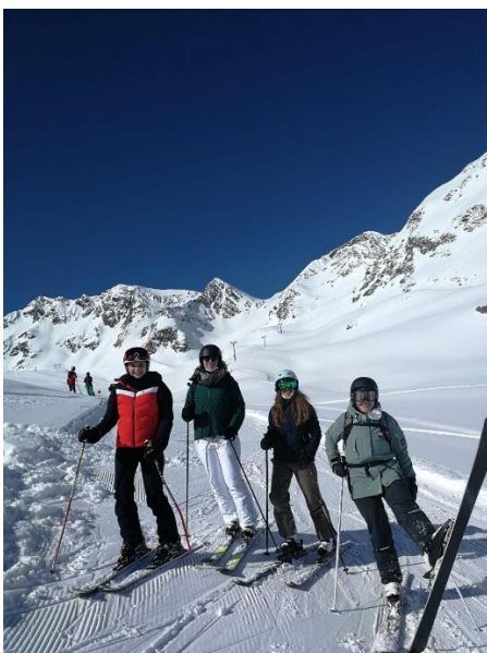
Skifahren am Stubaier Gletscher

Nähere Informationen dazu erhalten Sie im Akademischen Auslandsamt der Pädagogischen Hochschule Schwäbisch Gmünd.