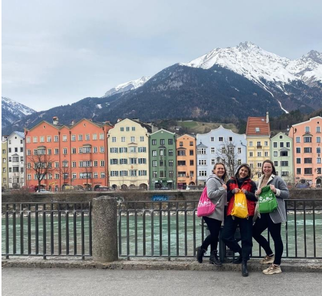
Vor dem Inn, am Marktplatz in Innsbruck