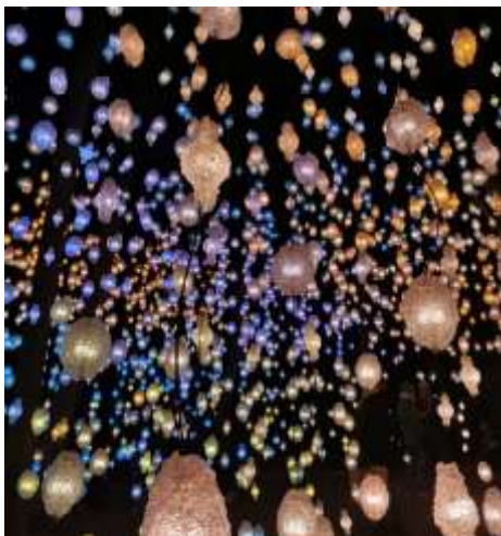
Abbildung 5: Ekebergparken Oslo (eigenes Foto, 2024)

Ursprünglich hatte ich befürchtet, Oslo könnte mir zu groß oder zu hektisch sein und der Naturbezug, der mir so wichtig ist, könnte verloren gehen. Doch das Gegenteil war der Fall: Ich habe selten eine Stadt erlebt, die so vielseitig ist und gleichzeitig so viel Ruhe ausstrahlt. Selbst im Stadtzentrum war der Lärmpegel erstaunlich niedrig, und die Natur war immer nur einen Katzensprung entfernt. Darüber hinaus habe ich mich in Oslo und ganz Norwegen stets sicher gefühlt, was meinen Aufenthalt umso angenehmer machte.