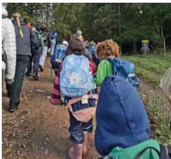
Abbildung 3: Schulbesuch