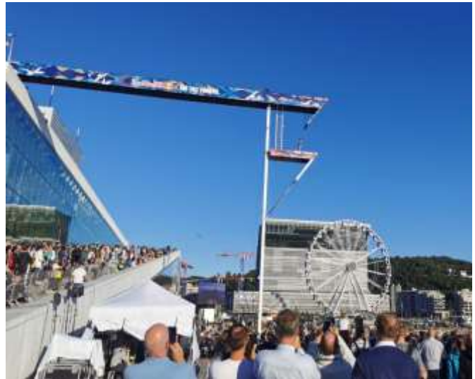
Abbildung 8: Red Bull Turmspringen Oslo (eigenes Foto, 2024)