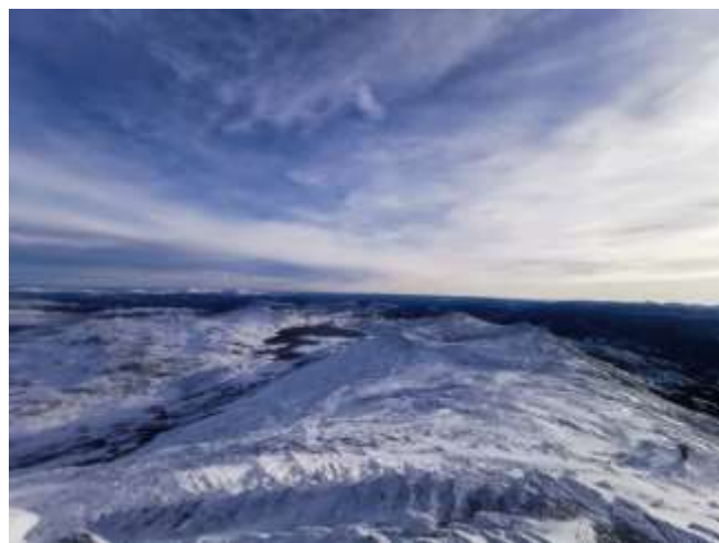
Abbildung 6: Gaustatoppen