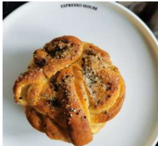
Abbildung 10:Kardemummabulle