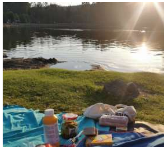
Abbildung 12: Sognsvann lake(eigenes Foto, 2024)