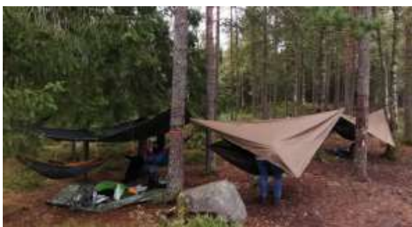
Abbildung 4: Outdoor Übernachtung