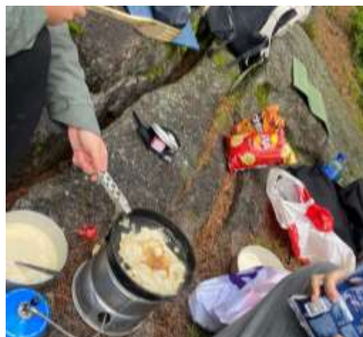
Abbildung 2: Tagesausflug