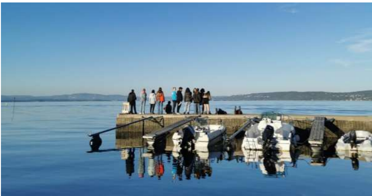
Abbildung 13: Strandheim (eigenes Foto, 2024)

Und schließlich: Einfach bewerben und machen! Es wird sich definitiv lohnen ☺