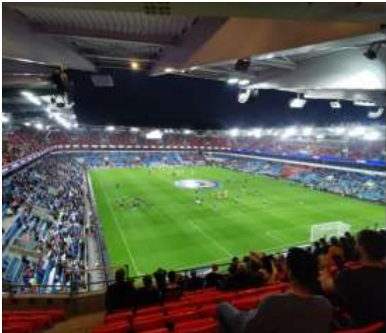
Abbildung 7: Fußballstadion Oslo (eigenes Foto, 2024)