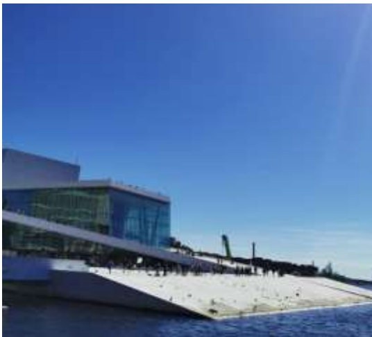
Abbildung 9: Oper Oslo