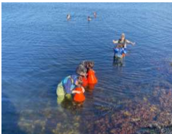
Abbildung 1: Strandheim (eigenes Foto, 2024)

Ich würde sagen, dass die Anforderungen in etwa denen in Deutschland entsprechen, was den Arbeitsaufwand und die Prüfungen betrifft. Insgesamt war das Studium an der OsloMet sehr abwechslungsreich und gut organisiert.