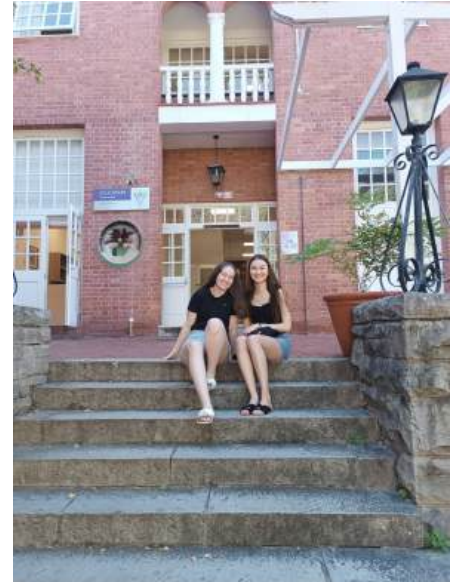
Vor dem Education Department

Ich hatte die Möglichkeit, von Februar bis Mai ein Auslandssemester an der Rhodes University in Makhanda, Südafrika zu verbringen. Diese Monate waren für mich sowohl fachlich als auch persönlich eine sehr prägende und bereichernde Zeit. Ich durfte eine fremde Kultur kennenlernen, neue Studieninhalte erarbeiten, wertvolle internationale Freundschaften schließen und viele Eindrücke mitnehmen, die meinen weiteren Lebensweg begleiten werden. Schon bei der Ankunft wurden wir vom International Office sehr herzlich aufgenommen und konnten uns auch danach jederzeit mit Fragen an sie wenden. Die Einführungswoche hatten wir leider aufgrund unserer Prüfungen in Deutschland verpasst aber mit Hilfe unseres Mentors konnten wir trotzdem sehr schnell Kontakt zu den anderen Austauschstudenten herstellen, was mir sehr geholfen hat, mich schnell zurechtzufinden und mich willkommen zu fühlen.