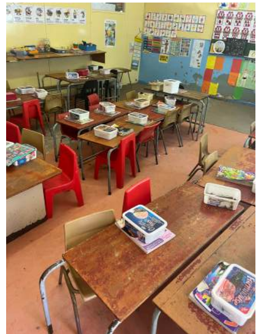
Klassenzimmer im Township