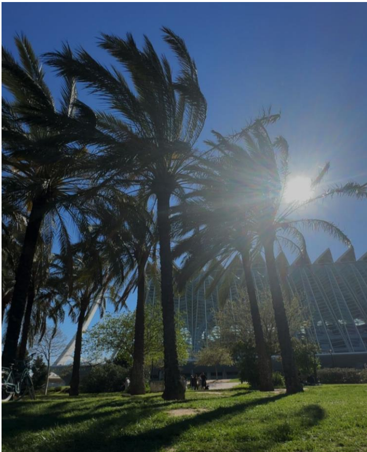
Relaxen im Turia-Park