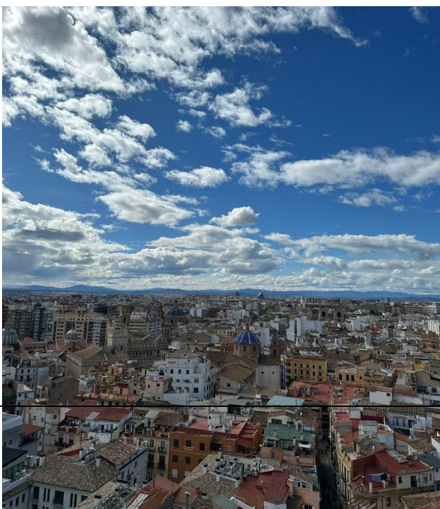
Aussicht von dem Kathedraalenturm