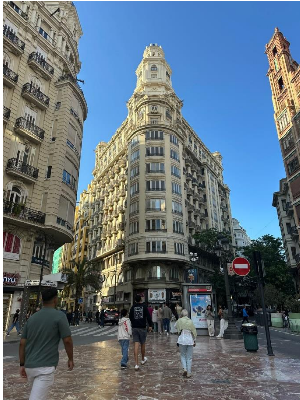
Innenstadt von Valencia

Zur Veranschaulichung meines Aufenthalts werde ich dem Bericht auch einige Fotos hinzufügen. Diese zeigen besondere Momente, Orte und Eindrücke, die mein Auslandssemester in Valencia geprägt haben.