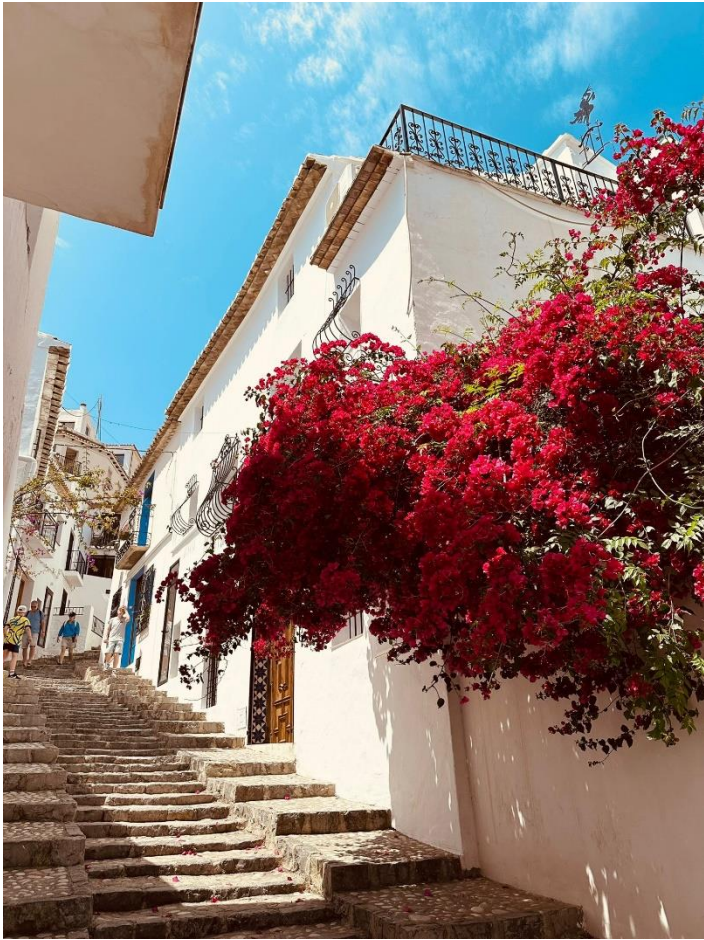
Ausflug nach Altea