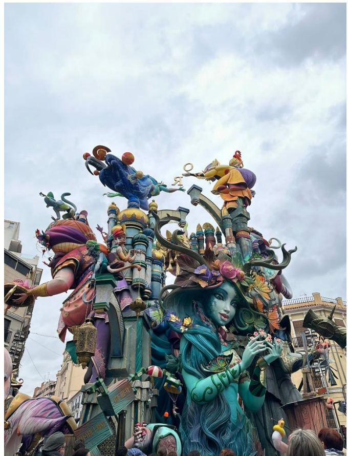
Figuren während Las Fallas