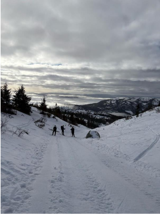
Wintertrip in Lifjell im Februar