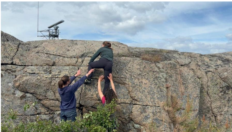
Bouldern beim Fieldtrip