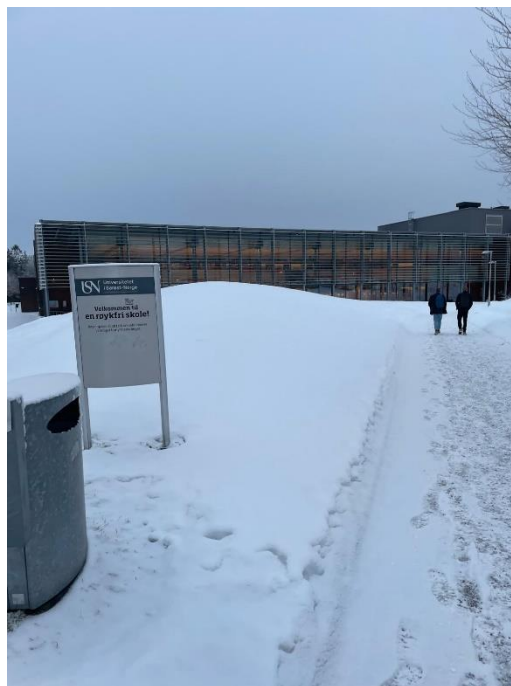
Die USN im Winter

Es war das mit Abstand das aufregendste und abwechslungsreichste Semester meines bisherigen Studiums. Ich würde es jeder Zeit wieder tun und somit auch jedem weiterempfehlen! Ich hoffe, ich kann mit meinem Erfahrungsbericht von diesem einzigartigen Semester berichten, offene Fragen beantworten und Interessierten zu einem Auslandssemester ermutigen!