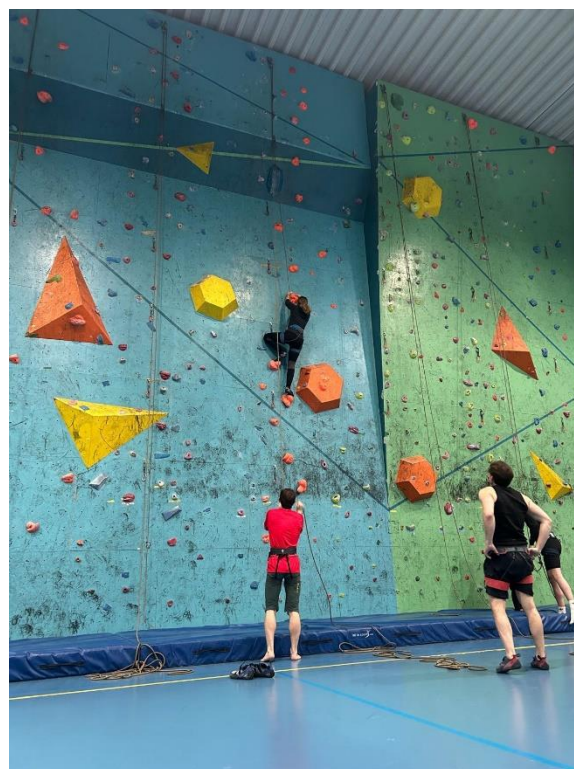
Klettern an der Uni

In meiner Freizeit habe ich sehr viel Sport getrieben. Der Weg am Strand entlang oder der Wald hinter dem Campus eignen sich perfekt zum Joggen oder Spazieren. Wer eher Krafttraining mag, kann sich eine Mitgliedschaft im Gym kaufen. Es gibt verschiedene Abomöglichkeiten. Entweder nur für einen Monat oder direkt für vier Monate, aber auch die Kombination aus Gym und Schwimmhalle ist möglich. Es gibt auch Kurse wie z.B. Cycling und Yoga. Komplette unabhängig hiervon ist der Vestfold Students Sports Club (VSIL). Hier werden die Sportarten Klettern, Volleyball, Fußball, Schach, Schwimmen, Floorball und Badminton angeboten. Hierfür muss man ebenso ein Abo abschließen, welches ungefähr 21€ kostet und für 5 Monate gilt, also für genau ein Semester. Hier ist aber wichtig, das Abo danach wieder zu kündigen, da es sonst automatisch verlängert wird! Ich habe besonders Volleyball, ab und zu auch Klettern besucht. Das war auf jeden Fall eines meiner Highlights im Semester und ich war sehr traurig als es in die Sommerpause ging. Die Personen, welche dort mitmachen, sind total offen und freuen sich