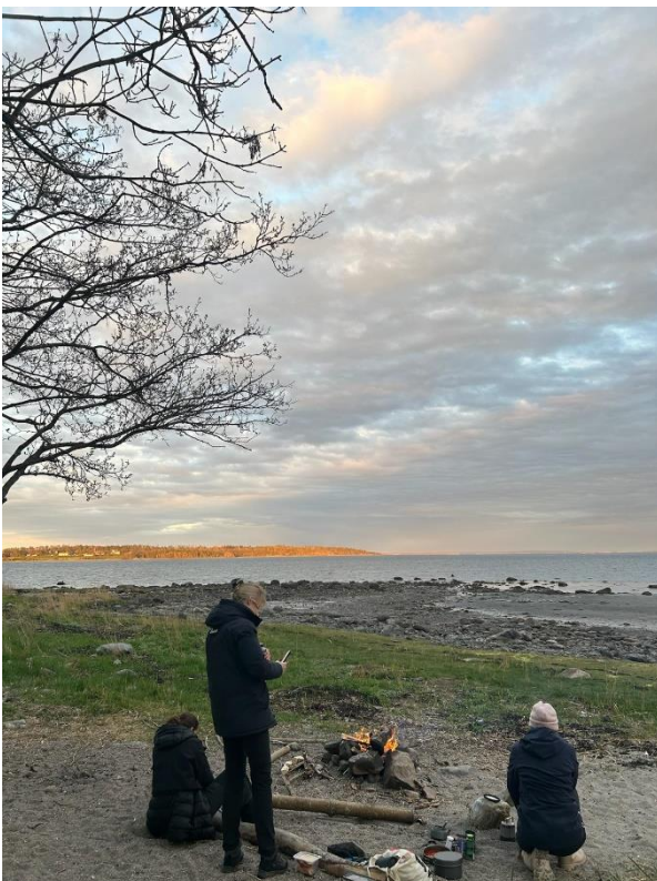
Erster Overnight-trip in Gruppen am Borrestrand