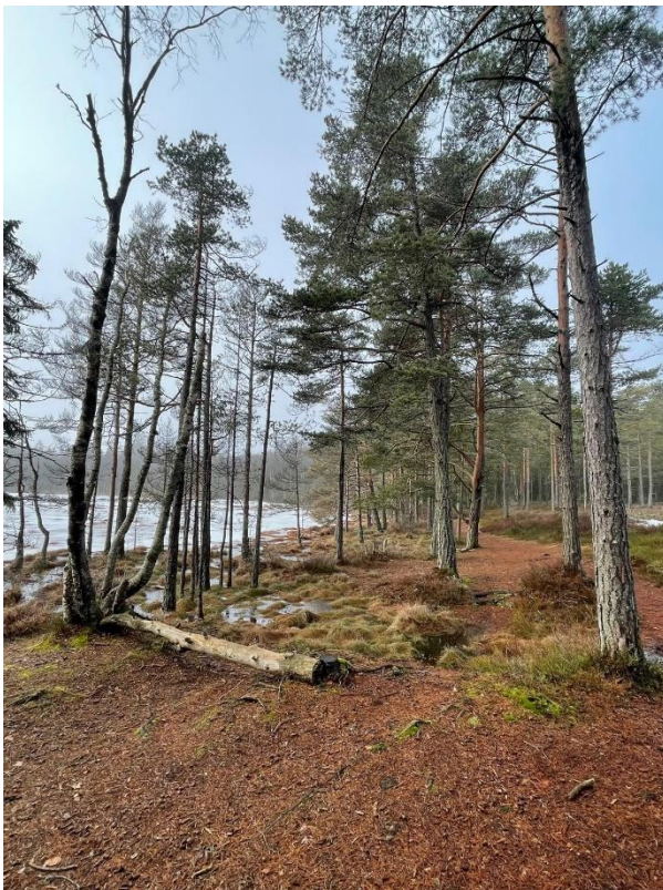
Unser Nature Place