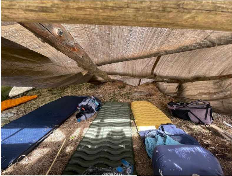
Schlafplatz in Verstecken