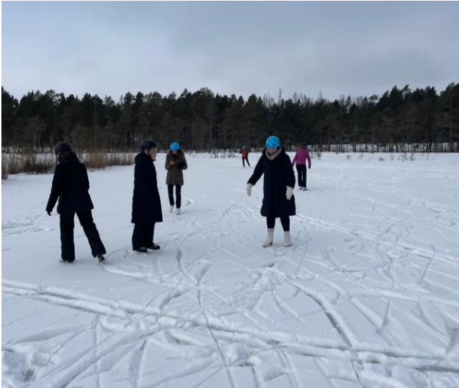
Eislaufen auf dem zugefrorenen See

Hier ein paar Eindrücke zu den Kursaktivitäten: