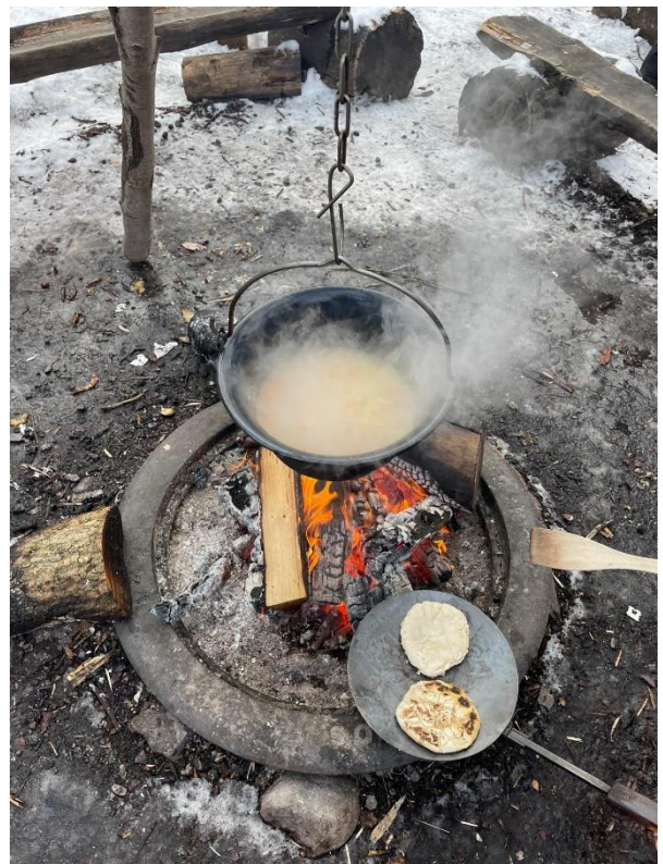
Essen zubereiten am Tag über die Sami