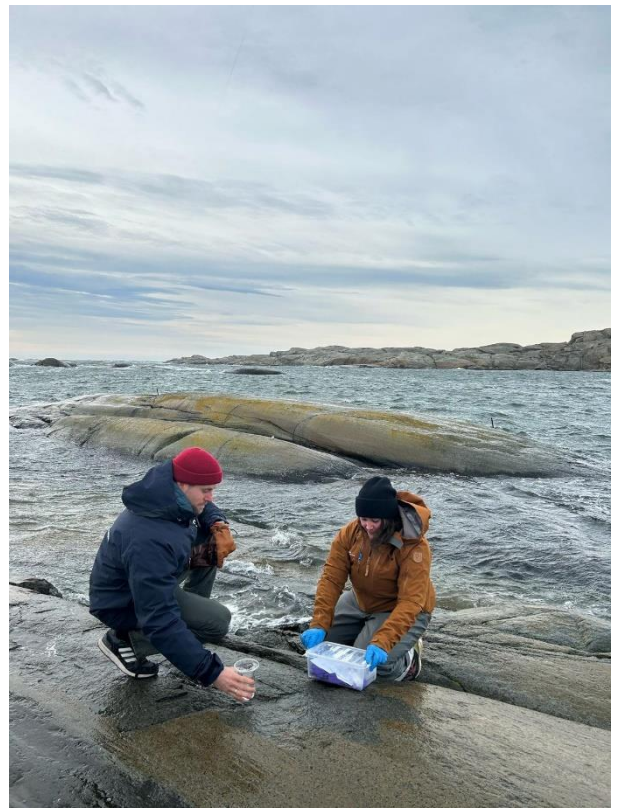
Wasserproben bei Verdens Ende