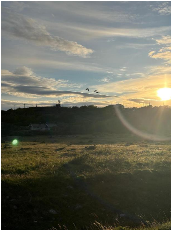
Abendspaziergang beim Overnight-Trip in Hvasser