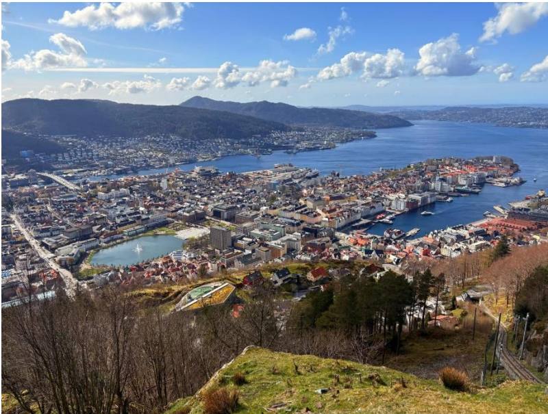
Bergen im April

Ein etwas anstrengendes, aber sehr hilfreiches Thema: AuslandsBAföG. Wenn ihr Inlands-BAföG erhaltet, dann beantragt auf jeden Fall auch Auslands-BAföG! Ihr habt dann auf jeden Fall Anspruch darauf und es hilft finanziell wirklich sehr. Selbst wenn ihr kein Inlands-BAföG bekommt, versucht es trotzdem, auch wenn es kräftezehrend sein kann.