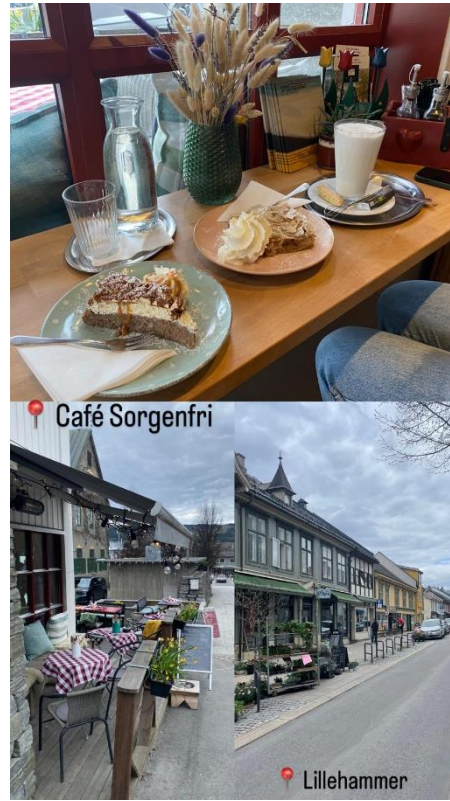
Lillehammer im Mai

Nun hoffe ich, dass mein Bericht dir viele Informationen über das Semester liefern konnte. Wenn du dich für ein Auslandssemester an der USN entscheidest, wünsche ich dir eine wunderschöne Zeit. Hab Spaß, sag ja zu Abenteuern und genieße jeden Moment. Es wird einzigartig!