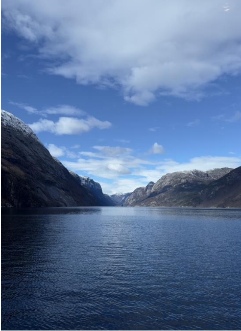
Ljsefjord (Fjord in Ryfylke)